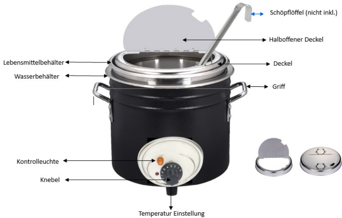
Abbildung 2. Teilebezeichnung.