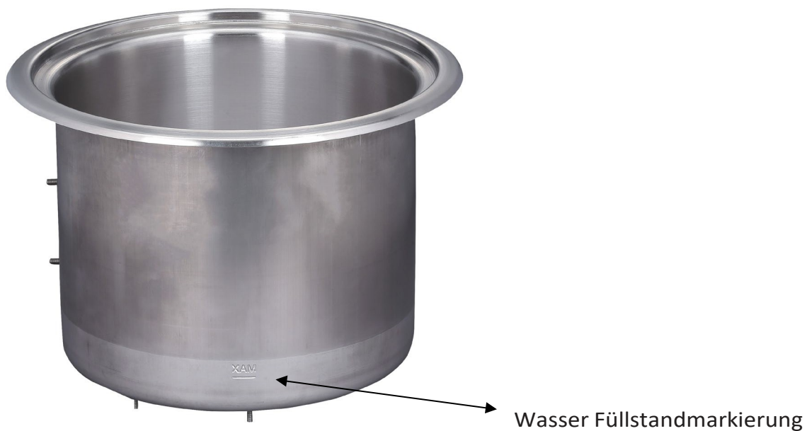
Abbildung 1. Wasser Füllstandmarkierung